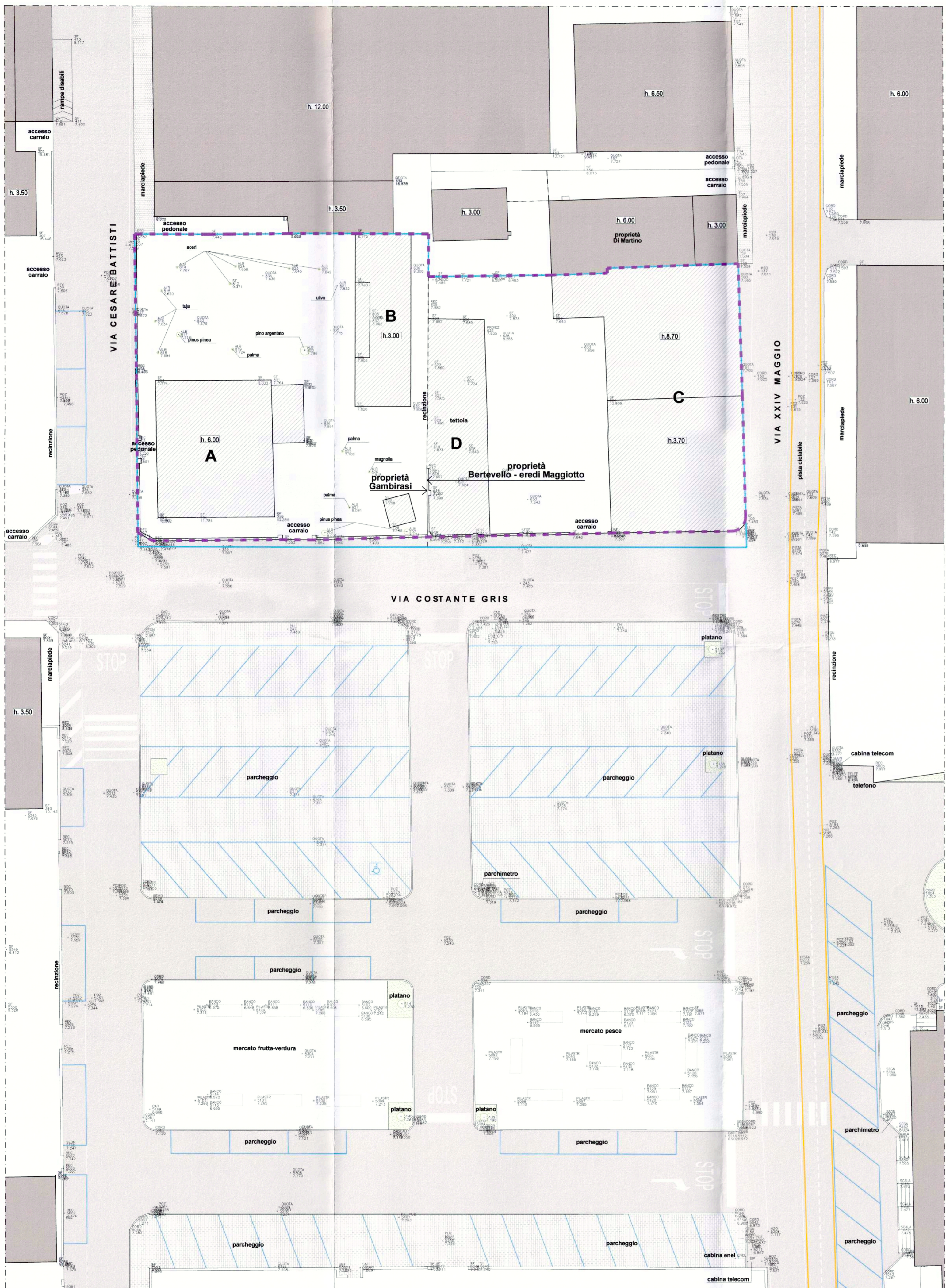
Planimetria rilievo dello stato di fatto scala 1/200